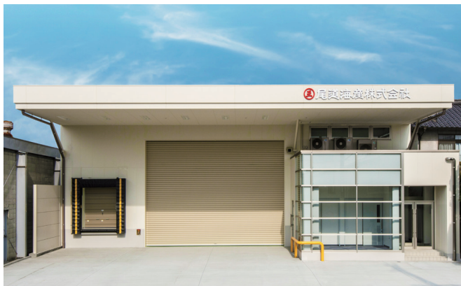
営業本部外観 Head Office