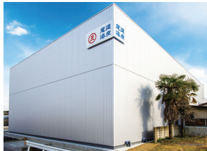
冷蔵庫 Refrigerating Wearhouse