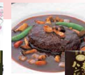
煮込み ハンバーグ

トマトケチャップ風味の ちょっと酸味が効いたソー スで仕上げました。お子様 にも大人気の一品です。