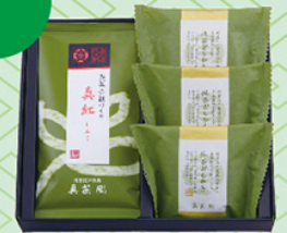
抹茶どらやき & 緑茶セット